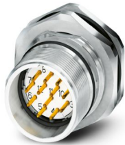
La figura mostra la versione a 12 poli con contatti a saldare

Si prega di notare che i dati visualizzati in questo PDF sono stati generati dal nostro catalogo online. I dati completi sono disponibili nella documentazione per l'utente. Si applicano le condizioni generali di utilizzo per i download.