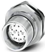
La figura mostra la versione a 12 poli

Si prega di notare che i dati visualizzati in questo PDF sono stati generati dal nostro catalogo online. I dati completi sono disponibili nella documentazione per l'utente. Si applicano le condizioni generali di utilizzo per i download.