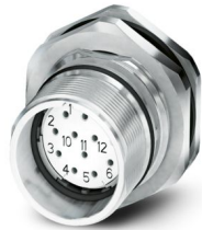
La figura mostra la versione a 12 poli

Si prega di notare che i dati visualizzati in questo PDF sono stati generati dal nostro catalogo online. I dati completi sono disponibili nella documentazione per l'utente. Si applicano le condizioni generali di utilizzo per i download.