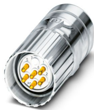
La figura mostra la versione a 6 poli con contatti a saldare

Si prega di notare che i dati visualizzati in questo PDF sono stati generati dal nostro catalogo online. I dati completi sono disponibili nella documentazione per l'utente. Si applicano le condizioni generali di utilizzo per i download.