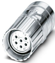
La figura mostra la versione a 6 poli

Si prega di notare che i dati visualizzati in questo PDF sono stati generati dal nostro catalogo online. I dati completi sono disponibili nella documentazione per l'utente. Si applicano le condizioni generali di utilizzo per i download.