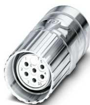
La figura mostra la versione a 6 poli

Si prega di notare che i dati visualizzati in questo PDF sono stati generati dal nostro catalogo online. I dati completi sono disponibili nella documentazione per l'utente. Si applicano le condizioni generali di utilizzo per i download.