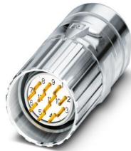
La figura mostra la versione con contatti a saldare

Si prega di notare che i dati visualizzati in questo PDF sono stati generati dal nostro catalogo online. I dati completi sono disponibili nella documentazione per l'utente. Si applicano le condizioni generali di utilizzo per i download.