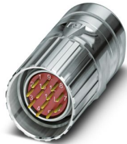
La figura mostra la versione a 12 poli

Si prega di notare che i dati visualizzati in questo PDF sono stati generati dal nostro catalogo online. I dati completi sono disponibili nella documentazione per l'utente. Si applicano le condizioni generali di utilizzo per i download.