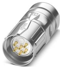
La figura mostra la versione con contatti a saldare

Si prega di notare che i dati visualizzati in questo PDF sono stati generati dal nostro catalogo online. I dati completi sono disponibili nella documentazione per l'utente. Si applicano le condizioni generali di utilizzo per i download.