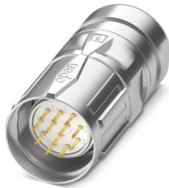
La figura mostra la versione a 12 poli con contatti a saldare

Si prega di notare che i dati visualizzati in questo PDF sono stati generati dal nostro catalogo online. I dati completi sono disponibili nella documentazione per l'utente. Si applicano le condizioni generali di utilizzo per i download.