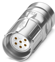
La figura mostra la versione a 6 poli

Si prega di notare che i dati visualizzati in questo PDF sono stati generati dal nostro catalogo online. I dati completi sono disponibili nella documentazione per l'utente. Si applicano le condizioni generali di utilizzo per i download.