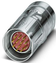
La figura mostra la versione a 12 poli

Si prega di notare che i dati visualizzati in questo PDF sono stati generati dal nostro catalogo online. I dati completi sono disponibili nella documentazione per l'utente. Si applicano le condizioni generali di utilizzo per i download.