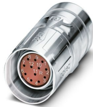
La figura mostra la versione a 12 poli

Si prega di notare che i dati visualizzati in questo PDF sono stati generati dal nostro catalogo online. I dati completi sono disponibili nella documentazione per l'utente. Si applicano le condizioni generali di utilizzo per i download.