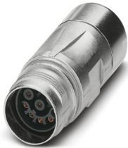
La figura mostra la versione a 8 poli

Si prega di notare che i dati visualizzati in questo PDF sono stati generati dal nostro catalogo online. I dati completi sono disponibili nella documentazione per l'utente. Si applicano le condizioni generali di utilizzo per i download.