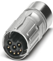
La figura mostra la versione a 8 poli

Si prega di notare che i dati visualizzati in questo PDF sono stati generati dal nostro catalogo online. I dati completi sono disponibili nella documentazione per l'utente. Si applicano le condizioni generali di utilizzo per i download.