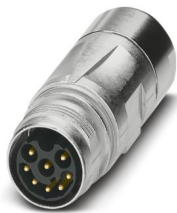
La figura mostra la versione a 8 poli

Si prega di notare che i dati visualizzati in questo PDF sono stati generati dal nostro catalogo online. I dati completi sono disponibili nella documentazione per l'utente. Si applicano le condizioni generali di utilizzo per i download.