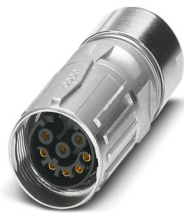
La figura mostra la versione a 8 poli

Si prega di notare che i dati visualizzati in questo PDF sono stati generati dal nostro catalogo online. I dati completi sono disponibili nella documentazione per l'utente. Si applicano le condizioni generali di utilizzo per i download.