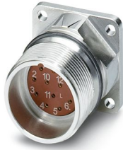
La figura mostra la versione a 12 poli

Si prega di notare che i dati visualizzati in questo PDF sono stati generati dal nostro catalogo online. I dati completi sono disponibili nella documentazione per l'utente. Si applicano le condizioni generali di utilizzo per i download.