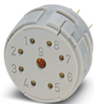
La figura mostra la versione a 9 poli

Si prega di notare che i dati visualizzati in questo PDF sono stati generati dal nostro catalogo online. I dati completi sono disponibili nella documentazione per l'utente. Si applicano le condizioni generali di utilizzo per i download.