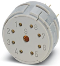
La figura mostra la versione a 9 poli

Si prega di notare che i dati visualizzati in questo PDF sono stati generati dal nostro catalogo online. I dati completi sono disponibili nella documentazione per l'utente. Si applicano le condizioni generali di utilizzo per i download.