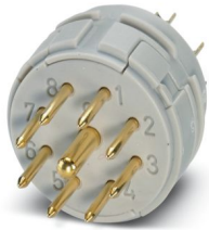
La figura mostra la versione a 9 poli

Si prega di notare che i dati visualizzati in questo PDF sono stati generati dal nostro catalogo online. I dati completi sono disponibili nella documentazione per l'utente. Si applicano le condizioni generali di utilizzo per i download.