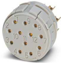
La figura mostra la versione a 12 poli

Si prega di notare che i dati visualizzati in questo PDF sono stati generati dal nostro catalogo online. I dati completi sono disponibili nella documentazione per l'utente. Si applicano le condizioni generali di utilizzo per i download.