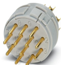
La figura mostra la versione a 12 poli

Si prega di notare che i dati visualizzati in questo PDF sono stati generati dal nostro catalogo online. I dati completi sono disponibili nella documentazione per l'utente. Si applicano le condizioni generali di utilizzo per i download.