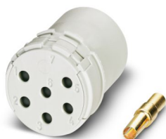
La figura mostra la versione a 6 poli

Si prega di notare che i dati visualizzati in questo PDF sono stati generati dal nostro catalogo online. I dati completi sono disponibili nella documentazione per l'utente. Si applicano le condizioni generali di utilizzo per i download.