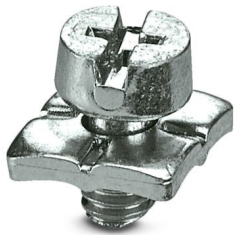
Vite PE, per inserto portacontatti HC-HS

Si prega di notare che i dati visualizzati in questo PDF sono stati generati dal nostro catalogo online. I dati completi sono disponibili nella documentazione per l'utente. Si applicano le condizioni generali di utilizzo per i download.