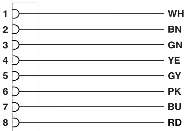
Schema di collegamento

Equipaggiamento dei contatti del connettore femmina M12