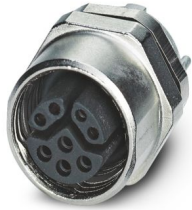
Passaparete M12, montaggio anteriore

Si prega di notare che i dati visualizzati in questo PDF sono stati generati dal nostro catalogo online. I dati completi sono disponibili nella documentazione per l'utente. Si applicano le condizioni generali di utilizzo per i download.