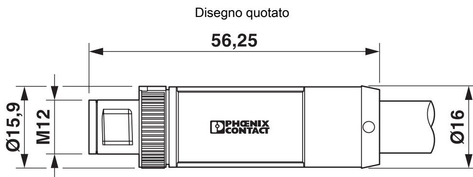
Connettore M12 x 1, diritto, schermato