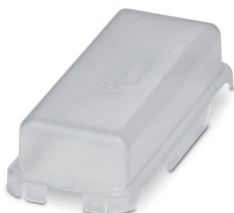
Coperchio di protezione, tipo: B16

Si prega di notare che i dati visualizzati in questo PDF sono stati generati dal nostro catalogo online. I dati completi sono disponibili nella documentazione per l'utente. Si applicano le condizioni generali di utilizzo per i download.