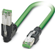
Cavo patch PROFINET

Si prega di notare che i dati visualizzati in questo PDF sono stati generati dal nostro catalogo online. I dati completi sono disponibili nella documentazione per l'utente. Si applicano le condizioni generali di utilizzo per i download.