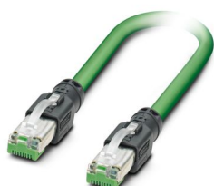
Cavo patch PROFINET

Si prega di notare che i dati visualizzati in questo PDF sono stati generati dal nostro catalogo online. I dati completi sono disponibili nella documentazione per l'utente. Si applicano le condizioni generali di utilizzo per i download.