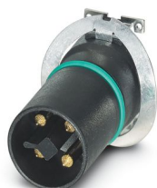
Kit campione, 4-poli, Connettore, diritto, M12, T-codifica, SMD Reflow

Si prega di notare che i dati visualizzati in questo PDF sono stati generati dal nostro catalogo online. I dati completi sono disponibili nella documentazione per l'utente. Si applicano le condizioni generali di utilizzo per i download.