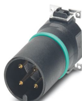
Kit campione, 4-poli, Connettore, diritto, M12, A-codifica, SMD Reflow

Si prega di notare che i dati visualizzati in questo PDF sono stati generati dal nostro catalogo online. I dati completi sono disponibili nella documentazione per l'utente. Si applicano le condizioni generali di utilizzo per i download.