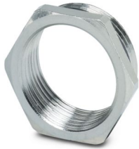
Adattatore di riduzione, filettatura: Pg21, colore: argento, con O-ring

Si prega di notare che i dati visualizzati in questo PDF sono stati generati dal nostro catalogo online. I dati completi sono disponibili nella documentazione per l'utente. Si applicano le condizioni generali di utilizzo per i download.