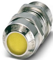
La figura illustra la versione G-ESIS-M25-M68N-NEPDS-S

Si prega di notare che i dati visualizzati in questo PDF sono stati generati dal nostro catalogo online. I dati completi sono disponibili nella documentazione per l'utente. Si applicano le condizioni generali di utilizzo per i download.