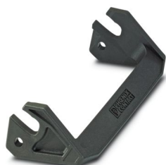
Bloccaggio longitudinale per custodia B24, HC-EVO....AL e HC-STA....AL

Si prega di notare che i dati visualizzati in questo PDF sono stati generati dal nostro catalogo online. I dati completi sono disponibili nella documentazione per l'utente. Si applicano le condizioni generali di utilizzo per i download.