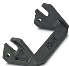
Bloccaggio longitudinale per custodia B16, HC-EVO....AL e HC-STA....AL

Si prega di notare che i dati visualizzati in questo PDF sono stati generati dal nostro catalogo online. I dati completi sono disponibili nella documentazione per l'utente. Si applicano le condizioni generali di utilizzo per i download.