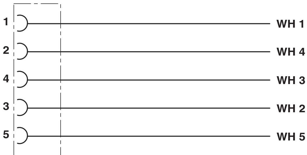
Schema di collegamento

Equipaggiamento dei contatti del connettore femmina M12