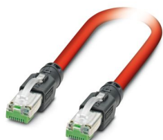
Cavo patch Sercos III

Si prega di notare che i dati visualizzati in questo PDF sono stati generati dal nostro catalogo online. I dati completi sono disponibili nella documentazione per l'utente. Si applicano le condizioni generali di utilizzo per i download.