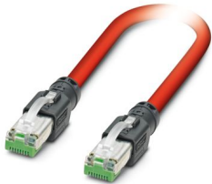
Cavo patch Sercos III

Si prega di notare che i dati visualizzati in questo PDF sono stati generati dal nostro catalogo online. I dati completi sono disponibili nella documentazione per l'utente. Si applicano le condizioni generali di utilizzo per i download.