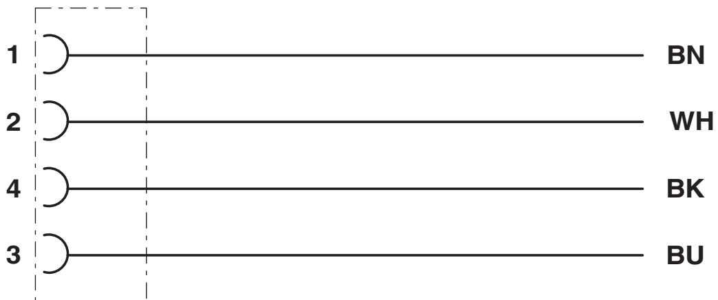
Schema di collegamento

Equipaggiamento dei contatti del connettore femmina M12