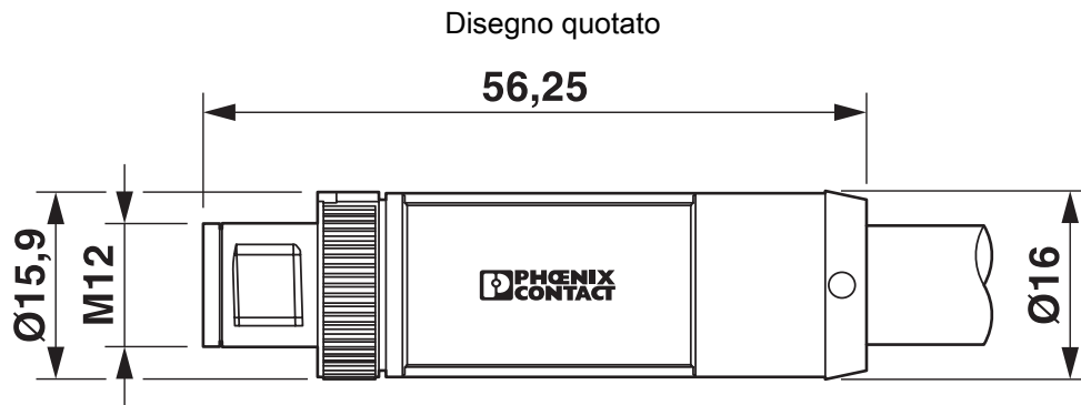
Connettore M12 x 1, diritto, schermato