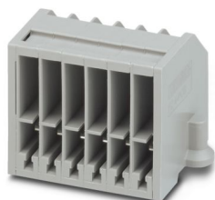
Custodia base per circuiti stampati, 6 poli

Si prega di notare che i dati visualizzati in questo PDF sono stati generati dal nostro catalogo online. I dati completi sono disponibili nella documentazione per l'utente. Si applicano le condizioni generali di utilizzo per i download.