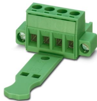
La figura illustra la versione a 4 poli dell'articolo

Connettore per circuiti stampati, sezione nominale: 2,5 mm 2 , colore: verde, corrente nominale: 12 A, tensione di dimensionamento (III/2): 320 V, superficie contatti: Sn, tipo di connessione del contatto: Femmina, numero dei potenziali: 5, numero di file: 1, numero poli: 5, numero di connessioni: 5, serie di prodotti: MSTB 2,5/..-STF, passo: 5,08 mm, tipo di connessione: Connessione a vite con gabbia, forma di attacco delle viti: L Fessura longitudinale, direzione di collegamento conduttore/scheda: 0 °, gancio di bloccaggio: - Gancio di bloccaggio, sistema di spine: COMBICON MSTB 2,5, bloccaggio: assente, tipo di fissaggio: assente, tipo di confezione: confezionato nel cartone