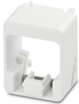
Telai di sicurezza Plug Guard

Si prega di notare che i dati visualizzati in questo PDF sono stati generati dal nostro catalogo online. I dati completi sono disponibili nella documentazione per l'utente. Si applicano le condizioni generali di utilizzo per i download.