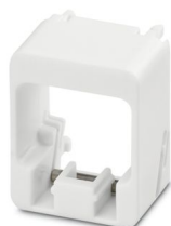
Telai di sicurezza Plug Guard

Si prega di notare che i dati visualizzati in questo PDF sono stati generati dal nostro catalogo online. I dati completi sono disponibili nella documentazione per l'utente. Si applicano le condizioni generali di utilizzo per i download.