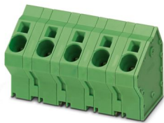
La figura illustra la versione a 5 poli dell'articolo

Morsetto circuito stampato, corrente nominale: 76 A, tensione di dimensionamento (III/2): 1000 V, sezione nominale: 16 mm 2 , numero dei potenziali: 5, numero di file: 1, numero di poli per fila: 5, serie di prodotti: SPTA 16/, passo: 15 mm, tipo di connessione: Connessione a molla Push-in, montaggio: Saldatura a onde, direzione di collegamento conduttore/scheda: 60 °, colore: verde, Layout Pin: Pinning a zigzag W, Lunghezza pin [P]: 4,1 mm, numero di pin di saldatura per potenziale: 3, tipo di confezione: confezionato nel cartone