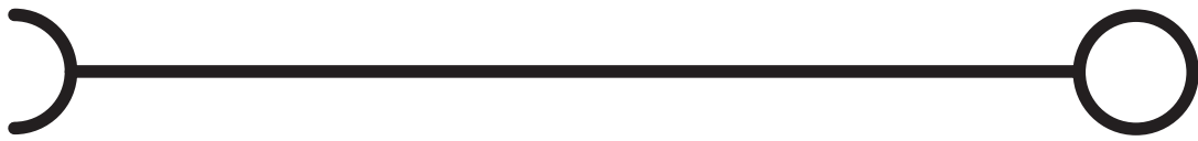
Schéma de connexion

https://www.phoenixcontact.com/fr/produits/3212701