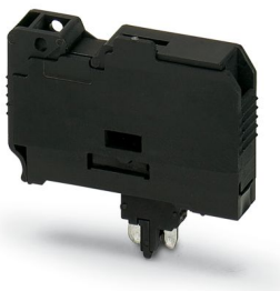
Fiche porte-fusible, intensité nominale: 10 A, type de fusible: G / 6,3 x 32, coloris: noir

Veillez tenir compte du fait que les données affichées dans ce document PDF proviennent de notre catalogue en ligne. Vous trouverez les données complètes dans la documentation utilisateur. Nos conditions générales d'utilisation des téléchargements sont applicables.