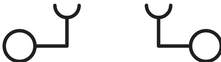
Schéma de connexion