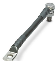
Câble de raccordement pour FLT-ISG-100-EX, longueur 100 mm.

Veillez tenir compte du fait que les données affichées dans ce document PDF proviennent de notre catalogue en ligne. Vous trouverez les données complètes dans la documentation utilisateur. Nos conditions générales d'utilisation des téléchargements sont applicables.