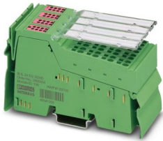
La figure montre la variante IB IL 24 DO 32/HD-PAC

Veillez tenir compte du fait que les données affichées dans ce document PDF proviennent de notre catalogue en ligne. Vous trouverez les données complètes dans la documentation utilisateur. Nos conditions générales d'utilisation des téléchargements sont applicables.