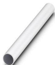
Tube, 1000 mm longueur, Ø 25 mm

Veillez tenir compte du fait que les données affichées dans ce document PDF proviennent de notre catalogue en ligne. Vous trouverez les données complètes dans la documentation utilisateur. Nos conditions générales d'utilisation des téléchargements sont applicables.